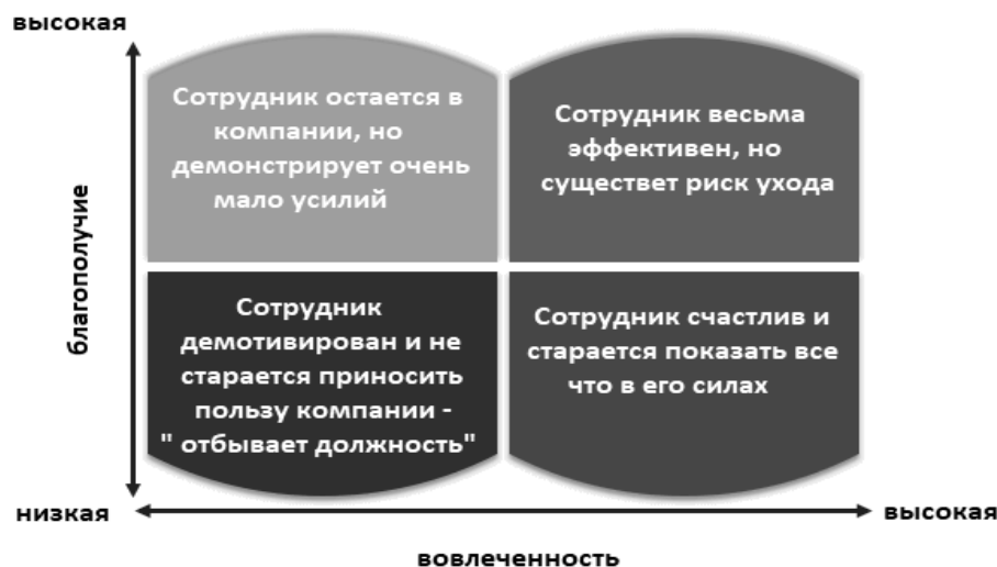
Рисунок 1. Взаимосвязь между вовлеченностью и благополучием

И так рассмотрев взаимосвязь между вовлеченностью и конкуренцией и раскрыв понятие вовлеченности перейдем к тому как можно увеличит вовлеченность.